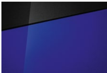
Intense Blue Pearl (YP5 – perłowy) (1) Dostępny również z dachem w kolorze Phantom Black Pearl (5YP)