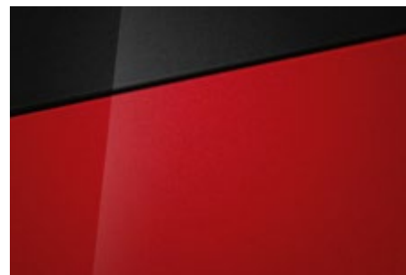
Dragon Red Pearl (WR7 – perłowy) Dostępny również z dachem w kolorze Phantom Black Pearl (5WR)