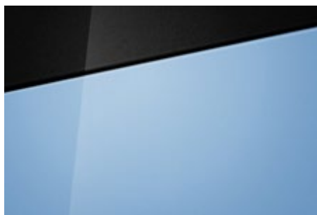
Performance Blue (XFB – specjalny) Dostępny również z dachem w kolorze Phantom Black (Pearl 5XF)