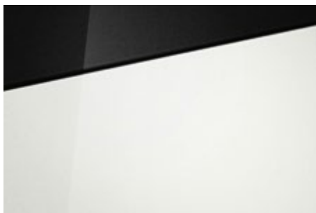
Atlas White (SAW – specjalny) Dostępny również z dachem w kolorze Phantom Black Pearl (5SA)