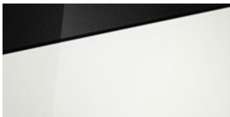
Atlas White (SAW – specjalny) Dostępny również z dachem w kolorze Phantom Black Pearl (5SA)