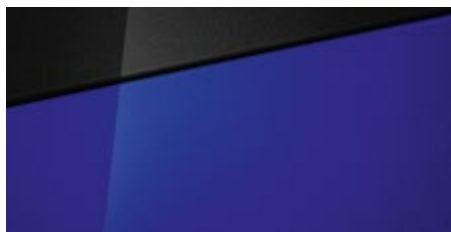
Intense Blue Pearl (YP5 – perłowy) Dostępny również z dachem w kolorze Phantom Black Pearl (5YP)