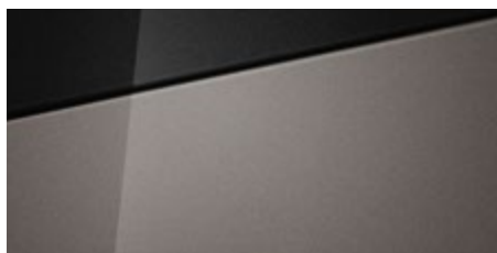
Elemental Brass Metallic (R3W – metaliczny) (1) Dostępny również z dachem w kolorze Phantom Black Pearl (5R3)