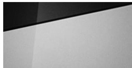
Sleek Silver Metallic (RYS – metaliczny) Dostępny również z dachem w kolorze Phantom Black Pearl (5RY)