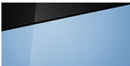
Performance Blue (XFB – specjalny) Dostępny również z dachem w kolorze Phantom Black (Pearl 5XF)