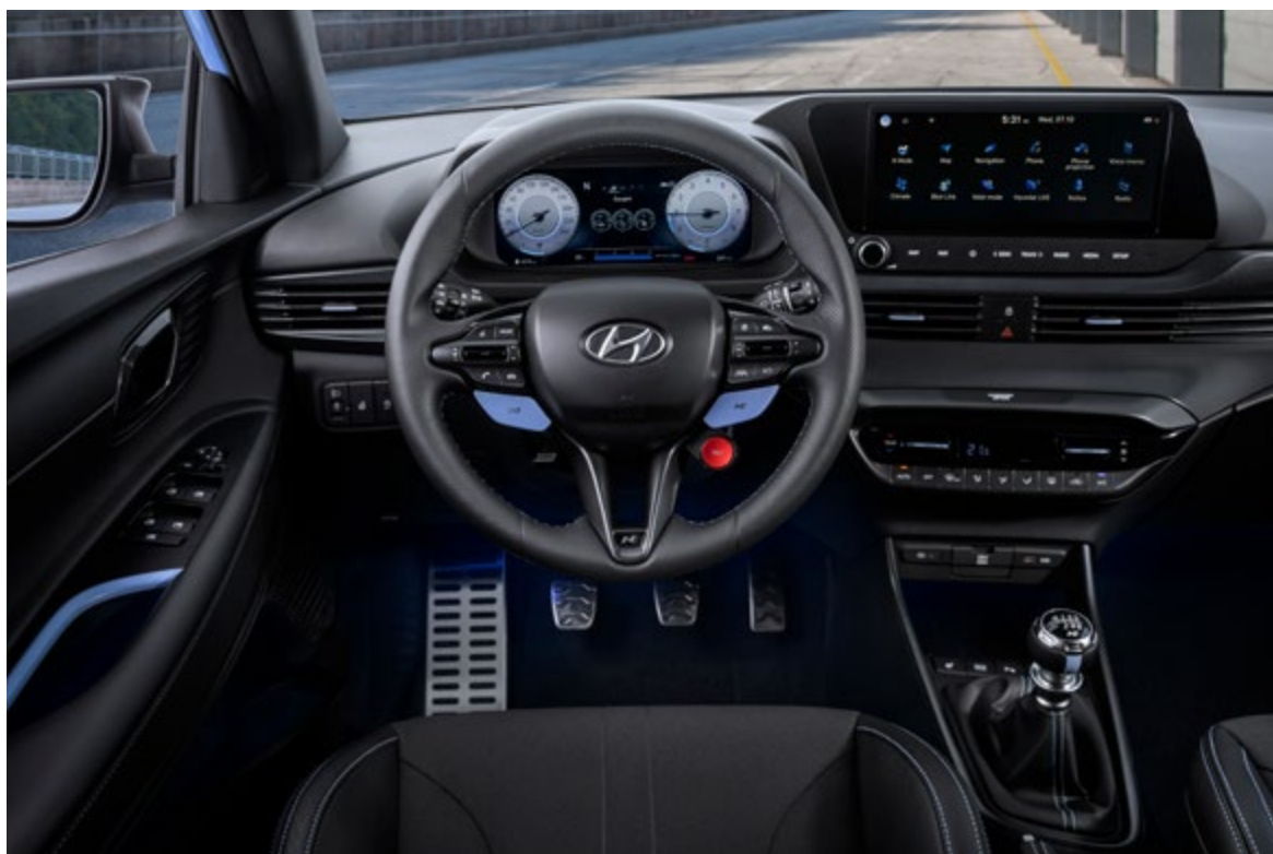
Czarne z akcentami w kolorze Performance Blue