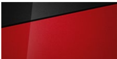
Dragon Red Pearl (WR7 – perłowy) Dostępny również z dachem w kolorze Phantom Black Pearl (5WR)